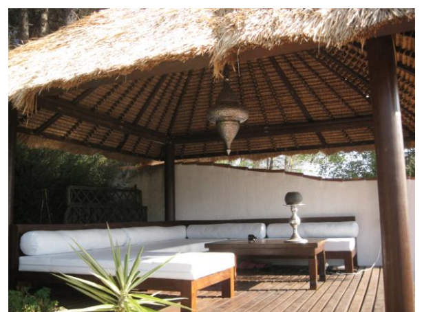
Bali pagod med chill-out area