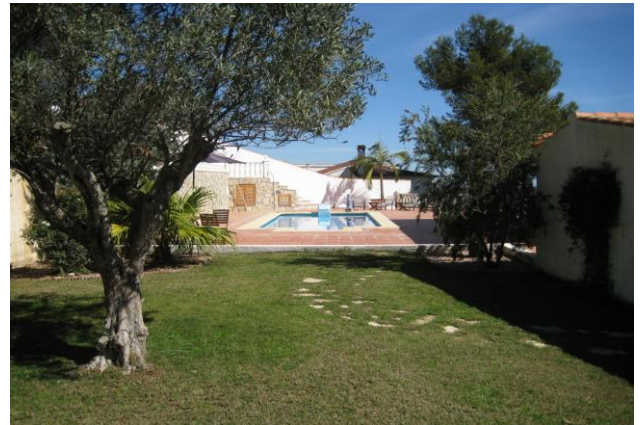
Trädgård med olivträd