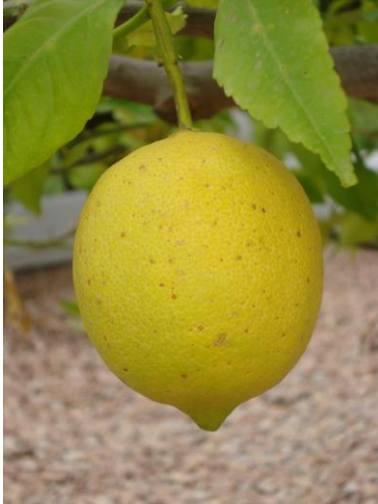
Citron nära till hands